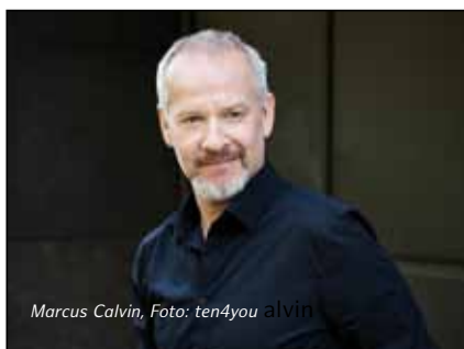
Marcus Calvin, Foto: ten4you alvin

Nach 20 Jahren CDU-Regierung wird Willy Brandt im Oktober 1969 zum ersten sozialdemokratischen Kanzler der noch jungen Bundesrepublik gewählt. In seiner Regierungserklärung fordert er, mehr Demokratie zu wagen. Brandt forciert gegen massive Anfechtungen eine Ostpolitik, die den Grundstein dazu legt, dass die beiden deutschen Staaten 1989 vereinigt werden. Als 1974 bekannt wird, dass es in Brandts allerengster Umge-