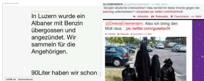
Keine Satire: Gewalt legitimierende oder verächtlich machende Botschaften

Viele Witze sind geeignet, mindestens eine der Varianten des Volksverhetzungstatbestands (§ 4 Abs. 1 Satz 1 Nr. 3 JMStV) zu erfüllen. Insbesondere können Humorinhalte, die an Gewaltverbrechen anknüpfen, als Aufforderung zu Gewalt- und Willkürmaßnahmen in der Gegenwart verstanden werden. In der durch einen Witz ausgedrückten Zustimmung kann zugleich die Verächtlichmachung der betroffenen Gruppen liegen, etwa wenn einer Bevölkerungsgruppe das Lebensrecht abgesprochen wird.