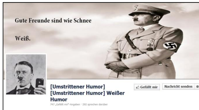
Strafbare Symbole: Unzulässig, wenn keine klare Distanzierung von der NS-Ideologie erfolgt

Vor allem in bildlichen Darstellungen kommt es häufig zur Verwendung von Kennzeichen verfassungswidriger Organisationen (§ 4 Abs. 1 Satz 1 Nr. 2 JMStV), wie dem Hakenkreuz oder SS-Runen. Ist nicht von vornherein offenkundig, dass sich die Abbildung gegen die Ideologie der verbotenen Organisation wendet, ist der Tatbestand grundsätzlich erfüllt.