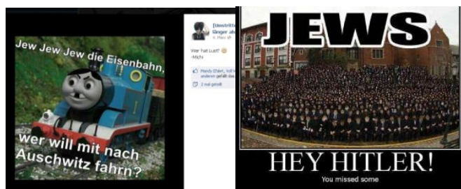
Bagatellisierung des Holocaust: Deportation nach Auschwitz als fröhliche Zugfahrt

Volksverhetzung in Form der Holocaustleugnung (§ 4 Abs. 1 Satz 1 Nr. 4 JMStV) ist in der Variante der Verharmlosung anzunehmen, wenn das Leid der Opfer durch den Witz heruntergespielt wird, z.B. indem die systematische Vernichtung von Juden bagatellisiert wird. Dies geschieht etwa, wenn die Deportation nach Auschwitz wie in einem Kinderlied als fröhliche Zugfahrt geschildert wird.