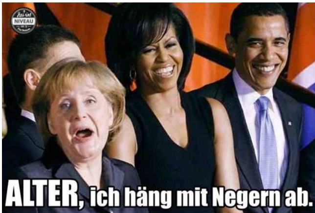
Rassistische Aussagen: Provozierende "Humorbeiträge" finden im Social Web schnelle Verbreitung

Auch jugendliche User werden durch die allgegenwärtigen Prinzipien des „Likens“ und Teilens leicht mit hetzerischen Humoringhalten konfrontiert. Viele neigen dazu, provozierende Beiträge unreflektiert im Freundeskreis oder gar öffentlich zu teilen. User können so zu Unterstützern rechtsextremer Kampagnen werden oder Zuspruch aus rechtsextremen Kreisen erhalten, ohne bislang Kontakt dorthin gehabt zu haben.